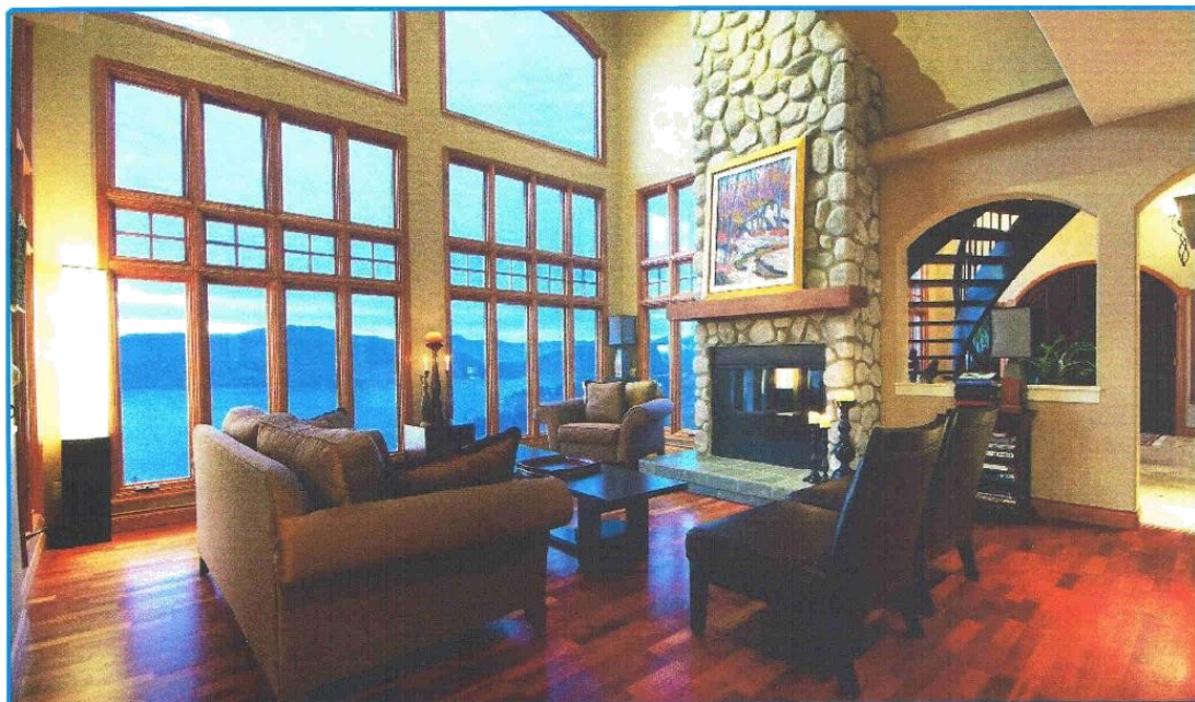
西温哥华 | 绝美的风景和奢华的生活对中国的买家最具诱惑力

2012年正是中国的农历龙年，温哥华房地产的房价是否会继续攀升还有待观望，但是在这个象征力量与财富的龙年，温哥华和中国的房地产市场定会发生更为重大的事件，让我们拭目以待。opp